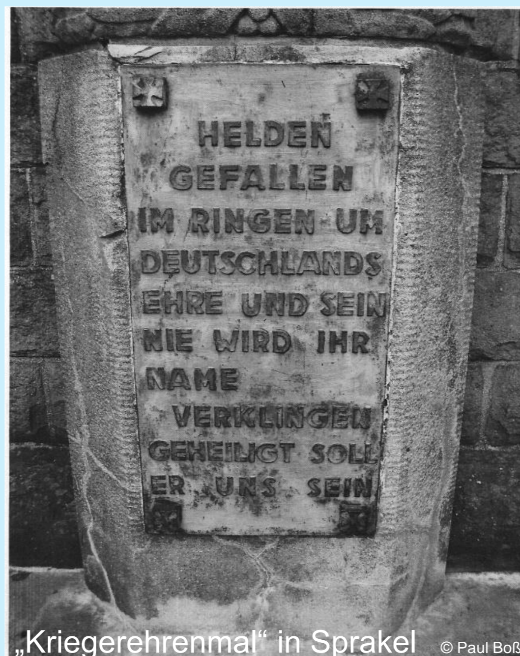
„Kriegerehrenmal“ in Sprakel